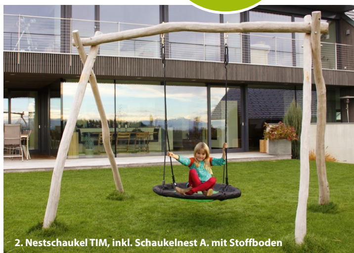
2. Nestschaukel TIM, inkl. Schaukelnest A. mit Stoffboden

WICHTIG Erdbefestigung der Schaukelpfosten erfolgt nur im Betonfundament