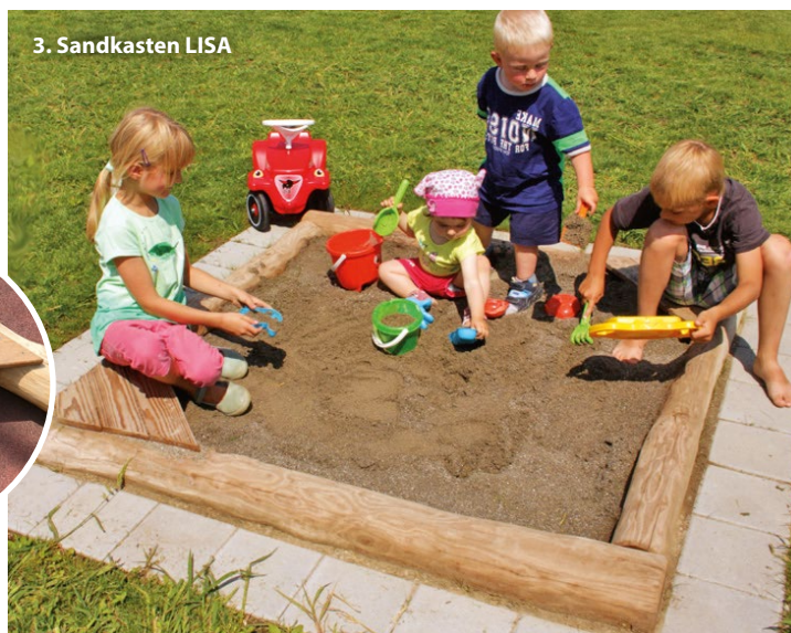
3. Sandkasten LISA