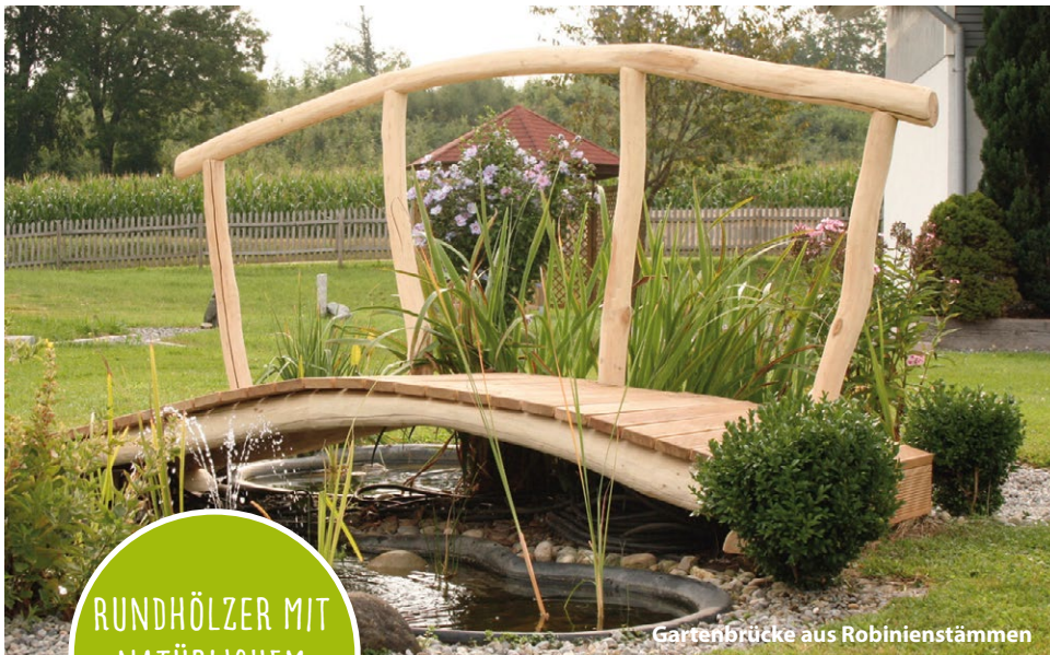
Gartenbrücke aus Robinienstämmen