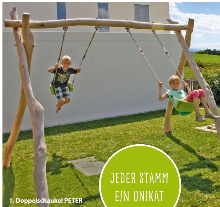
1. Doppelschaukel PETER